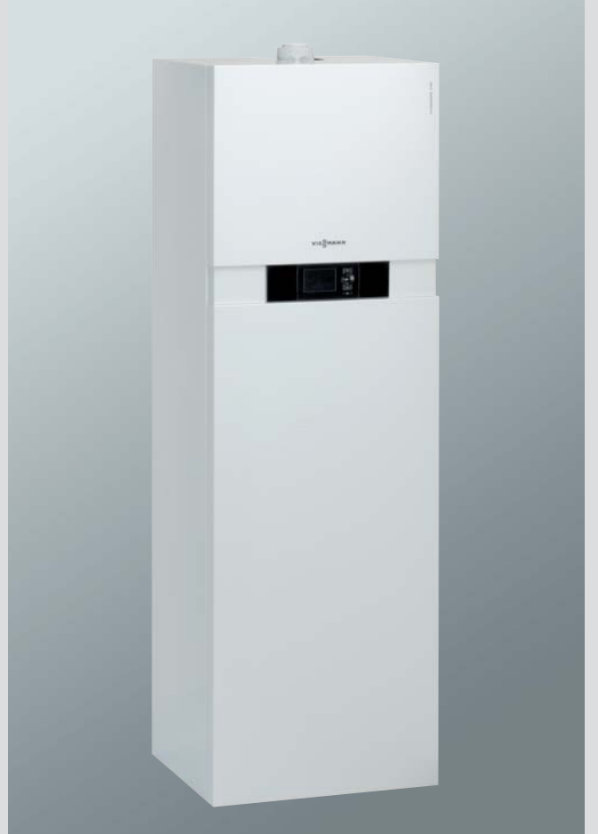
Vitodens 242-F Güneş enerjisi destekli, gaz yakıtlı kompakt yoğuşmalı kazan (Boylere hacmi 170 litre)