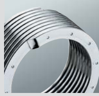
Inox-Radial ısıtma yüzeyi

■ Akıllı Lambda Pro Control sistemi sayesinde, gaz tipini kendiliğinden tanıyarak değişken gaz niteliklerine ve işletme şartlarına en uygun yanma koşullarını otomatik olarak ayarlar.