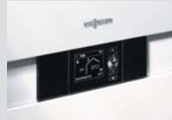
Yeni dijital Vitotronic kontrol paneli