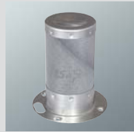
MatriX- silindirik brülör