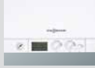
Dijital göstergeli kontrol paneli